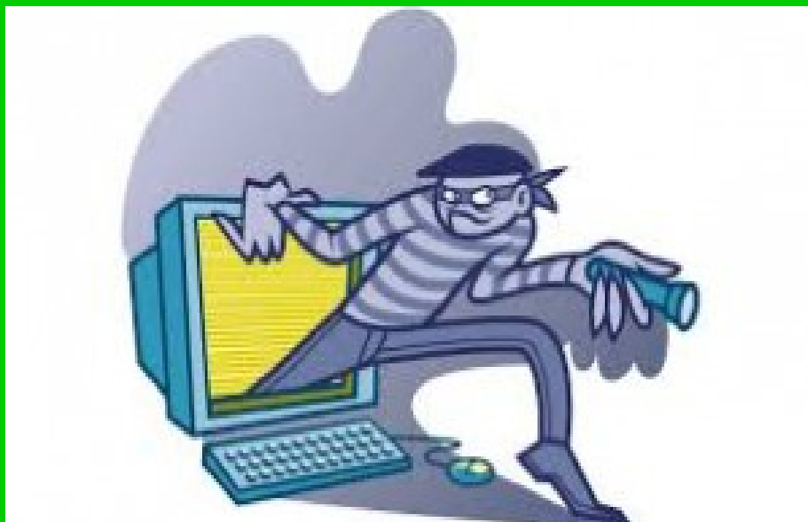
La vignetta che rappresenta un pirata informatico