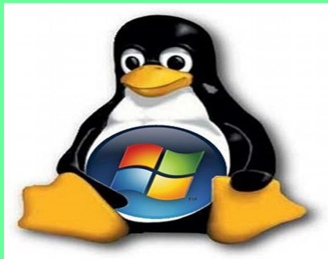
Logo Linux (pinguino) e Logo Windows

Sono in molti, coloro che si chiedono se Linux, il sistema operativo completamente libero e gratuito, possa essere il valido sostituto di Windows, che è il sistema operativo piu' utilizzato al mondo.