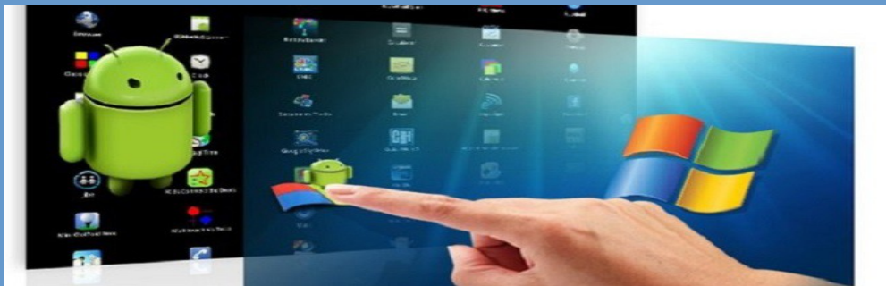
Android e Windows

Inoltre, è opportuno precisare, che i tablet, sono in una buona fetta di mercato, dotati di sistema operativo Android (per un 85%), e questo impedisce di far avvicinare un tablet, ad un pc, con tutto ciò che ne consegue.