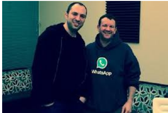
Acton insieme a Jan Koum, l' altro founder di Whatsapp

cancellare da Facebook, per evitare di essere spiati, e per mantenere al sicuro, la propria privacy.